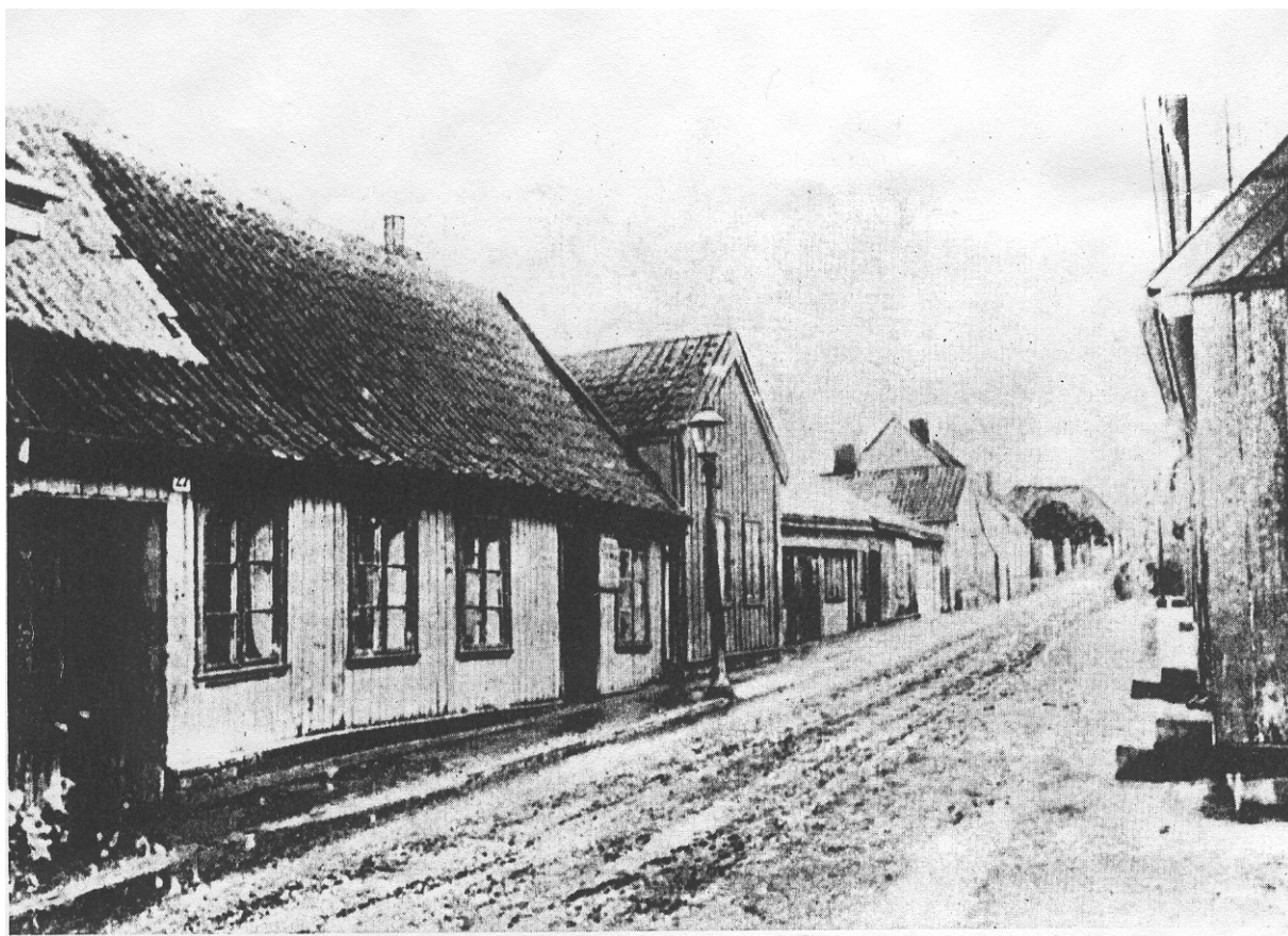
Foto av Bispegaten fra ca 1890. Huset til venstre er nr 27. Hustaket øverst til høyre er OsloLadegård. Inntil 1874 het gaten Strandgaten. Bortsett fra Oslo Ladegård er alle bygningene på bildet revet.