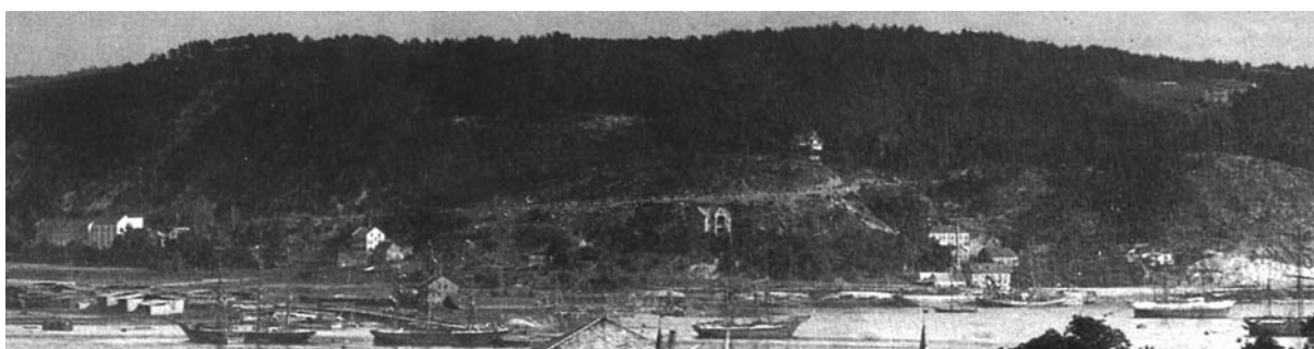
Fotografi av Kongshavn fra seilskutetiden. Teateret kan sees midt på høyre halvdel av bildet.