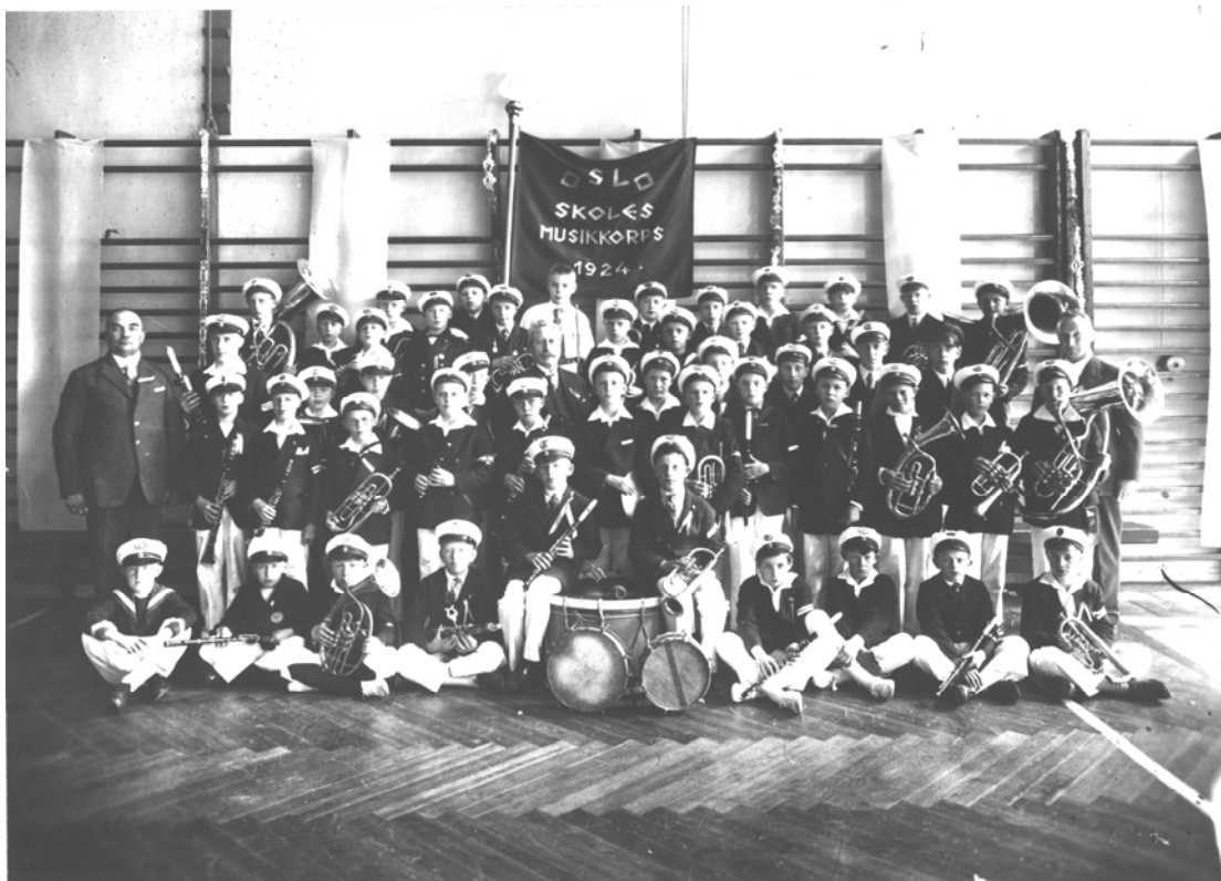
”Oslo Skoles Musikkorps” var navnet på Gamlebyen skoles musikkorps.

skolen hang det bilder i glass og ramme med lag som hadde vunnet skolemesterskap i slåball. Lusefrøken kom jevnlig med sin finkam.